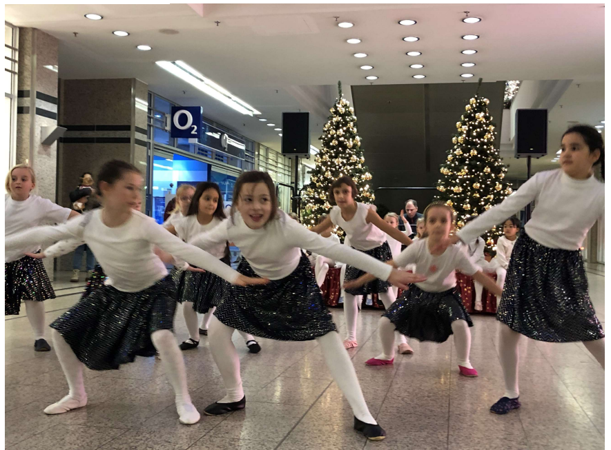
Die Tanzteufel der Schiller Schule