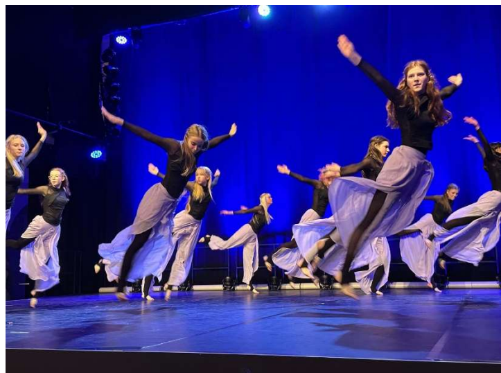
Home town mit den Future Dancern