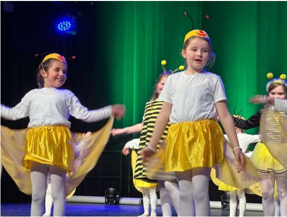
Die Gruppen Tanzsterne und Harlekin mit