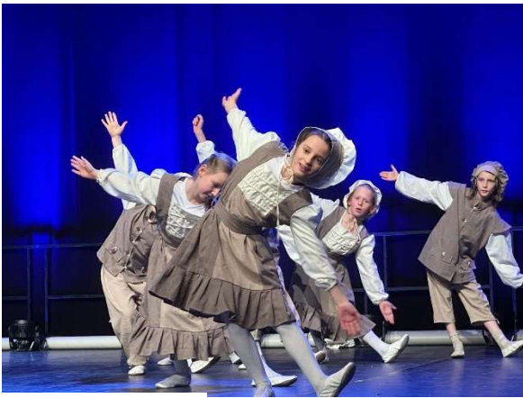
Die Flotten Käfer