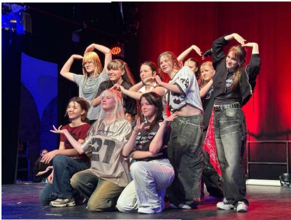
K-Pop mit der Gruppe StayHigh