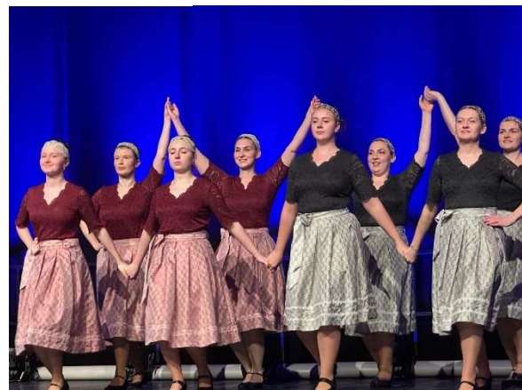
Unsere Gäste: Der Werrataler Tanzkreis