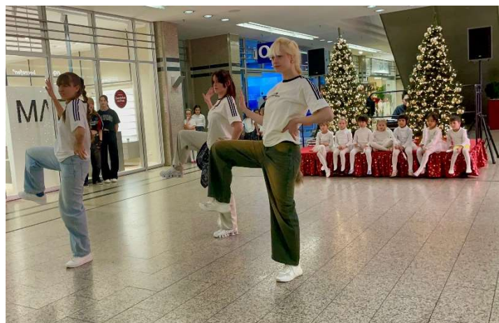
K-Pop mit Stay H!gh