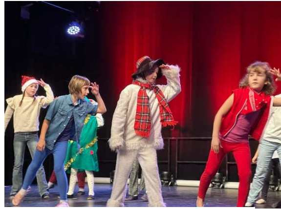
Die Tanzteufel der Schiller Schule