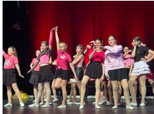
Die Dance Girls