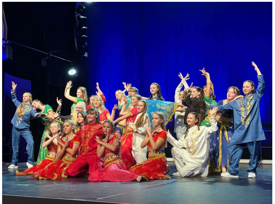
Bollywood mit T-Mix und den Future Dancern